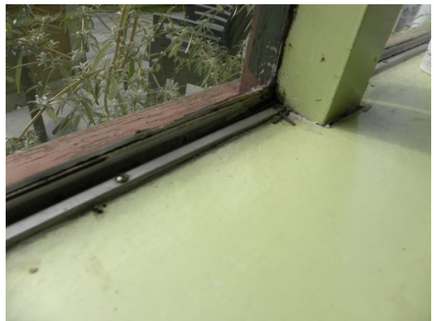
Enkel glas geeft ook vochtproblemen