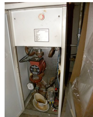
CV ketel 1990