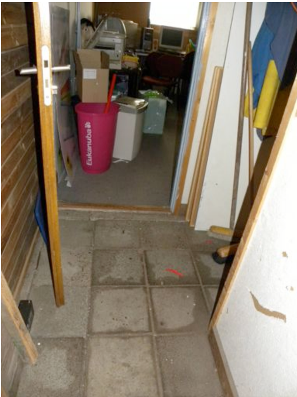
Vloer binnen deels stoeptegels –op-zand