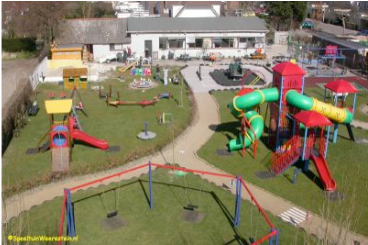
De speeltuin (deels) 2009 met gebouw vanaf zuidzijde. Links het asbestdak.