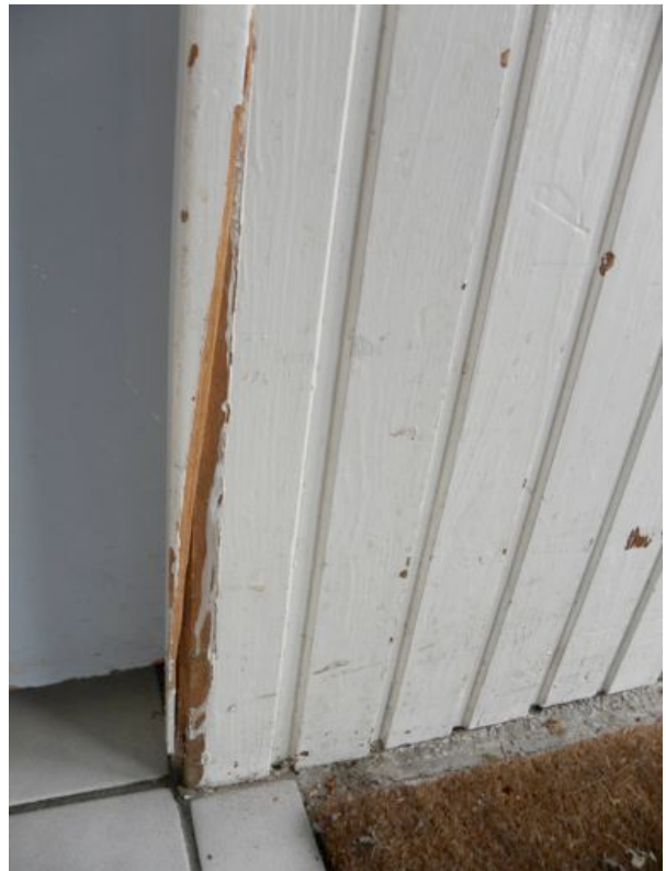
Binnen betimmering houten schroten